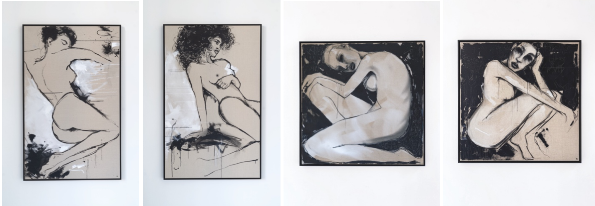
The Archive of Unfinished Thoughts I | 2025 | Acryl & Kohle auf unbehandelter Leinwand | 150 x 100 cm